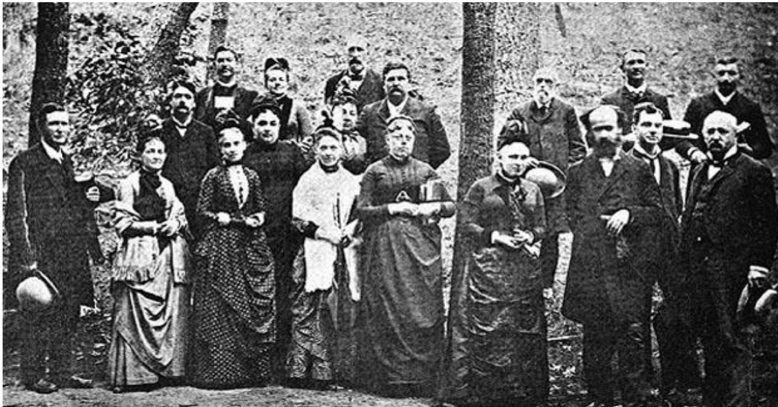
Los primeros miembros de la Iglesia Alianza Cristiana y Misionera. El pastor Simpson aparece en primera fila, tercero a la derecha. 1886

En el año 1887 fundó una organización misionera denominada: Alianza Cristiana y Misionera, con el propósito de predicar el Evangelio en América y enviar misioneros al mundo. Desde entonces empezaron instalar centros misioneros en otros países para predicar el evangelio y fundar congregaciones que se denominaron igual que la misión fundadora. Hoy existen muchas iglesias de la Iglesia Alianza Cristiana y Misionera a nivel mundial en más de 50 países.